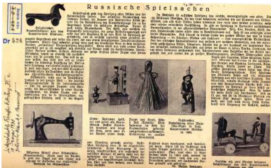
Een artikel van Walter Benjamin over zijn collectie Russisch speelgoed

Hierboven noemden we Walter Benjamin bij gebrek aan een betere benaming 'auteur', maar dat is een wat armoedige titel voor iemand die diepgravend filosofeerde over taal en cultuur, historische studies verrichtte, literaire teksten vertaalde, politieke beschouwingen verzorgde en kunstkritiek bedreef. Benjamin was allereerst een intellectuele veelvraat. De onderwerpen waar hij zich zijn leven lang, en met name ook in het Passagen Werk , mee bezighield zijn zo heterogeen, dat het moeilijk is om er de rode draad in te ontdekken. Het is ook niet heel eenvoudig om een goede ingang in het werk te vinden, alleen al omdat veel van zijn werk, ook het Passagen Werk , door Benjamins voortijdige dood onvoltooid bleef. Veel van zijn nagelaten werk bestaat uit losse notities, die hij allereerst voor zichzelf schreef, en die soms nog nader moesten worden uitgewerkt alvorens gepubliceerd te worden. Het is echter de vraag of Benjamin bij leven en welzijn wel tot voltooiing van zijn vele, vele manuscripten zou zijn gekomen. Het lijkt alsof Benjamin de schijnbare mislukking van zijn vele onvoltooide projecten bewust heeft opgezocht met een welbepaald, maar nooit heel expliciet uitgesproken doel voor ogen. Benjamins Passagen Werk is aan de oppervlakte een vorm van neo-marxistische geschiedschrijving, maar onder de oppervlakte ligt een mystiek doel verborgen. 1