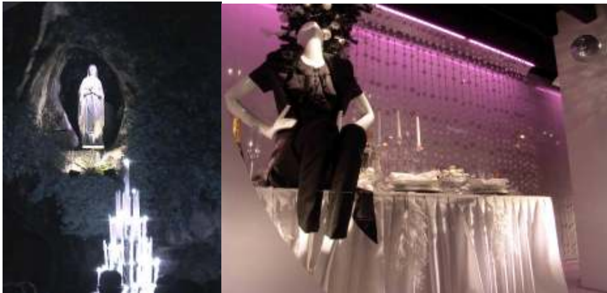
Van mythe naar warenfetisjisme: de Grot van Lourdes en een kerstetalage in de Bijenkorff

het hele systeem van mode en bijbehorende advertenties. Het gaat er daarbij meestal niet meer om wat de functie van de waar is, maar wat het symboliseert - status, bij de tijd zijn, maar ook: triomf over l'ennui , de om zich heen grijpende plaag van de verveling, die geboorte geeft aan het type van de dandy en de poète maudit , zoals Baudelaire, met zijn spleen .