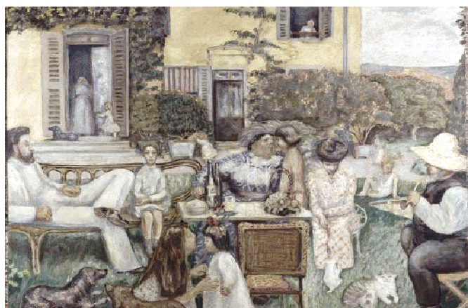
'Een burgermans namiddag, of de terrasfamilie', door Pierre Bonnard, 1900

Benjamin ziet in de passages het verlangen van de stadsburger om werelds, mondain , outgoing te zijn, maar dan wel in een veilige omgeving. In de passages manifesteert zich een verlangen om tegelijk binnen en buiten te zijn. Interieur en exterieur worden er als het ware 'poreus', wat voor Benjamin een zeer uitdagend en modern idee is. Maar de brave burger is altijd bang voor verandering. Hij hecht hij aan zijn vaste plek in de samenleving en daarom is het voor Benjamin geen toeval dat juist in deze periode óók de cultus van de huiskamer opkomt, waar de wanden worden versierd met allerlei exotische snuisterijen. In de beschermende veiligheid van de huiskamer, kan de burger zich een wereldreiziger wanen.