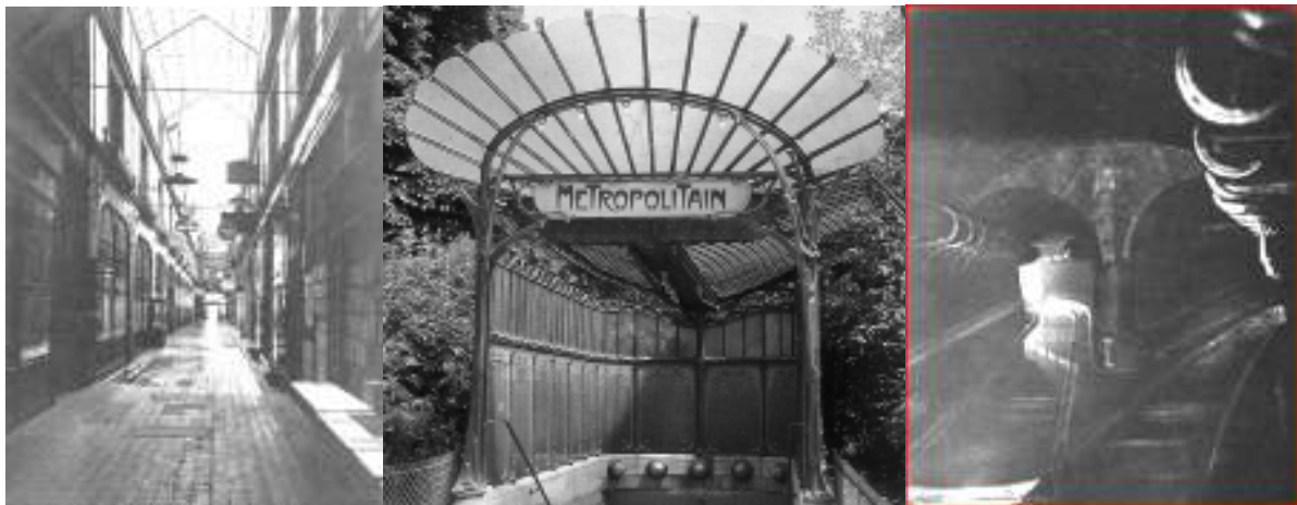
v.l.n.r.: Passage de l'Opéra, een metro-ingang en het riool van Parijs

Benjamin observeert hoe de ingangen van passages vanouds al werden geflankeerd door bedelaars en automaten waarin men een muntje moet gooien: om een pop te laten bewegen, of om jezelf te wegen. Benjamin ziet hierin een gelijkenis met de mythische ingang van de Hades, de Griekse onderwereld. Een overledene kon het dodenrijk slechts ingaan door een muntje aan de veerman te geven, een muntje dat bij de begrafenis onder de tong van de gestorvene werd gelegd. Eén van de convoluten is gewijd aan de catacomben van Parijs, en Benjamin wijst op verbanden in de typologie van de passages en diverse andere Parijse 'onderwerelden' - die van de métro en het riool bijvoorbeeld, of die van het oudste Parijs, zoals dat zichtbaar werd bij de grootscheepse sloopwerken van Haussmann. In de 19 e eeuw zijn er, temidden van alle vernieuwingen, verbazend veel fantasieën over de verwoesting en ondergang van Parijs. Men is ernstig bezig met het moment dat de lichtstad zal zijn verworden tot een dode ruïne.