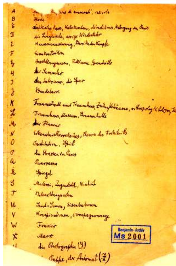
Benjamins hangeschreven index bij het 'Passagen Werk'