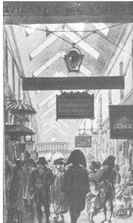
De Passage des Panoramas in Parijs op een anonieme aquarel, ca 1810

Rondom de passages manifesteerde zich een nieuwe, grootschalige en op moderne technologie gebaseerde vermaaksindustrie: zo waren er de geschilderde panorama's en meer van die pre-cinematografische attracties, zoals diorama's of de fantasmagorieën. Diorama's waren een soort theaters, waarin met veel kunst- en vliegwerk exotische werelden konden worden opgeroepen; fantasmagorieën waren voorstellingen waarbij met een soort toverlantaarn op wieltjes spookbeelden op muren, rook of halftransparante schermen konden worden geprojecteerd.